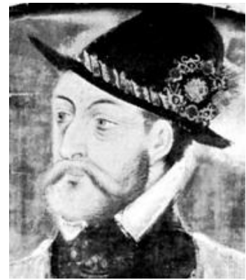
Lamoraal, Graaf van Egmond (1522-1568)

De Kerkmeer tenslotte moest de visrechten, die rustten op het Kerkmeer, eerst afkopen en bijdragen in de kosten van de molens, sluizen, verlaten en overtuimen aan de Oosterdijk.